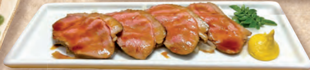
[合鴨冷製治部煮(ハーフ)]