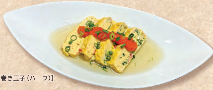
[だし巻き玉子(ハーフ)]